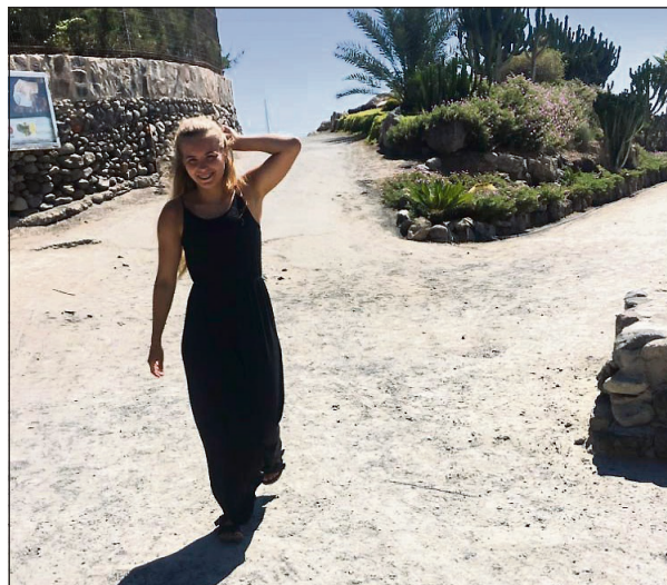
TRYGT: De norske elevene på skolen føler seg trygge og er ikke redd for å gå i byen alene.