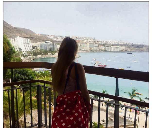
FINT VÆR: Det er veldig varmt og de benytter seg mye av stranden etter skolen.